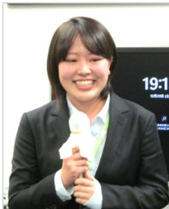
中央大学 已上 小楽咲