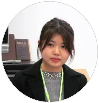
当日インフルエンザで欠席 別日に研修を受講